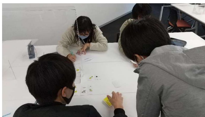
グループでのアイデア出しの様子